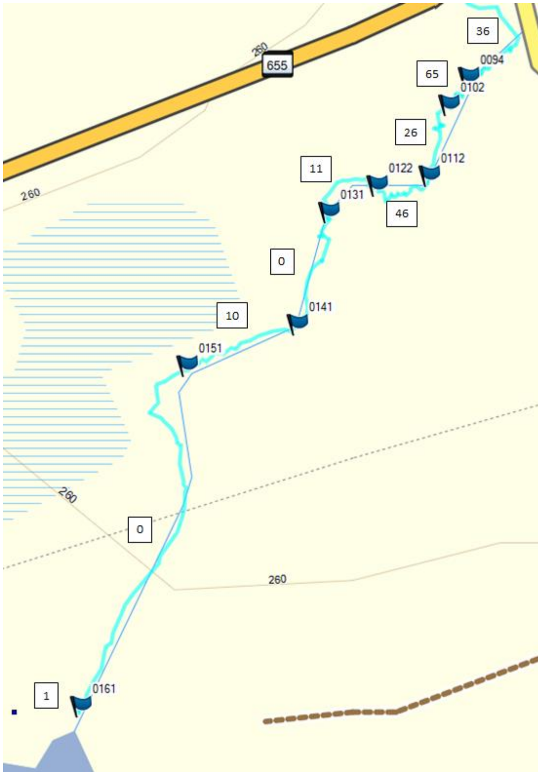
Fig 2 viser hvor mange skjell som ble sett mellom veipunktene. På punktet 0161 var der en elvemusling 5-6 m opp fra steinkloppa, 8-10 m fra vasskant.