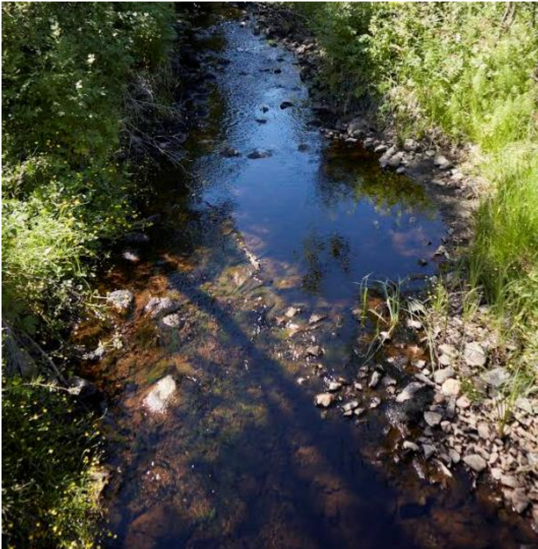
Fig 1. Sommeren 2018 var en av de tørreste i «manns minne» og det var svært lite vatn i elva. Bildet er tatt oppstrøms der tellingen startet.

Undersøking av tilstand til elvemusling 2018 ved utløp Videtjørn, Ørsta kommune, Møre og Romsdal.