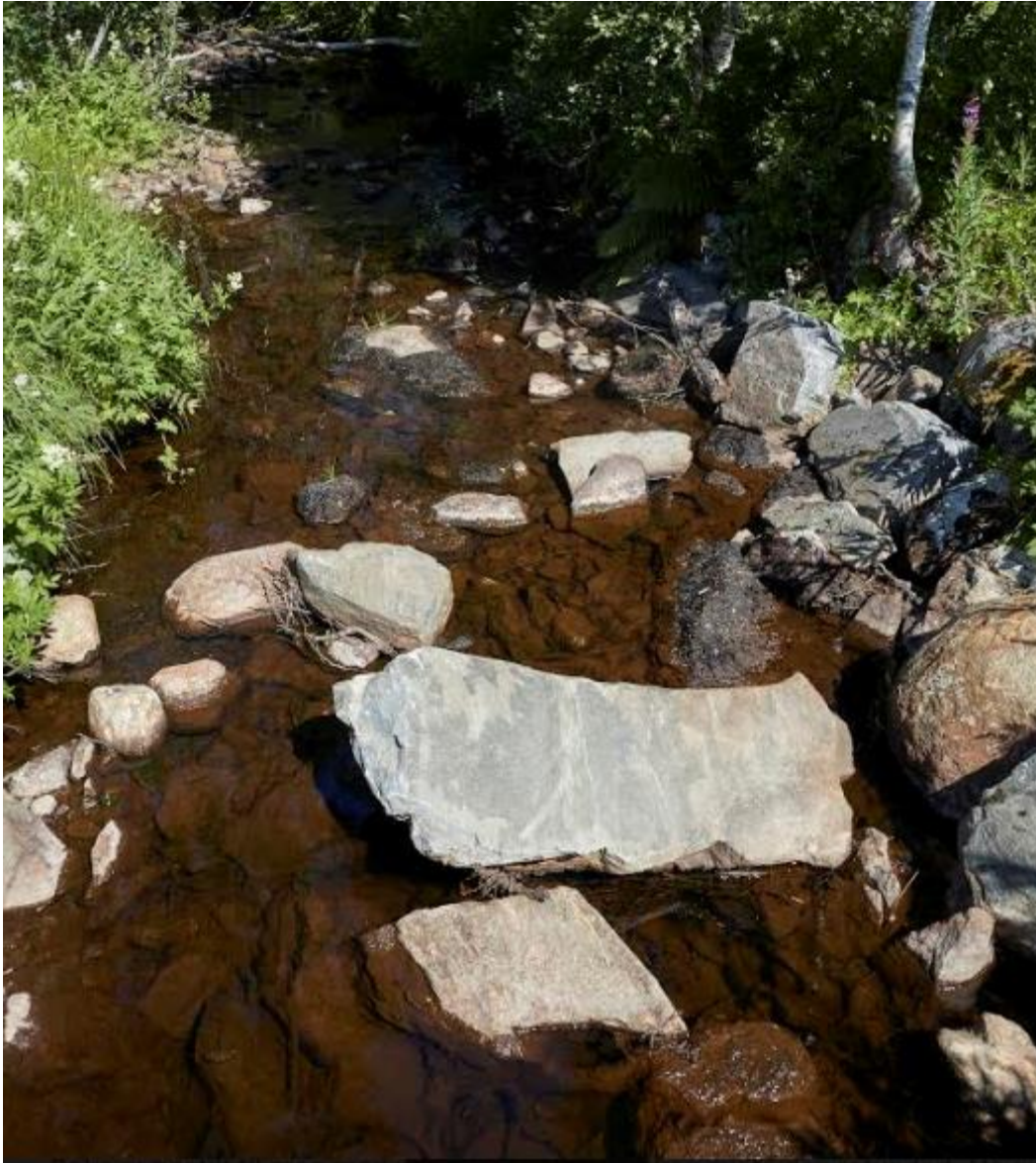
Fig 5 viser nedstrøms broa der tellingen startet. Her ble det for få år siden gravd for å legge nye rør gjennom veien, derfor er steiner uten mosedekke. Bildet er tatt med for å vise hvor brun bunnen av elva var under tellingen.

Tre vedlegg: Telling fra 1993 og fra 2000.