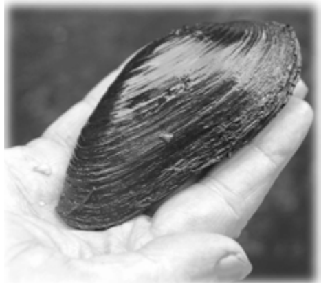
Elvemusling (Margaritifera margaritifera)